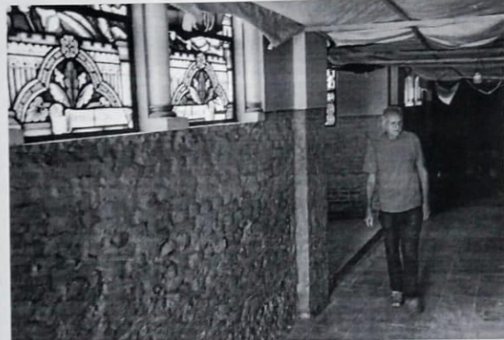
Reforma consiste na retirada do antigo reboco para aplicação de uma camada impermeabilizante

Devido à umidade, reboco será trocado. A obra deve durar 90 dias, mas não altera funcionamento das missas