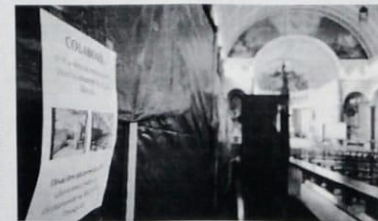
Contribuições podem ser feitas pelo Pix (51) 99913-1962

Depois disso, iniciou-se uma campanha para reconstruir a igreja, reinaugurada em 1958. Na época, a comunidade fazia festas para arrecadar recursos para a construção. As paredes que estão sendo reformadas datam desse período.